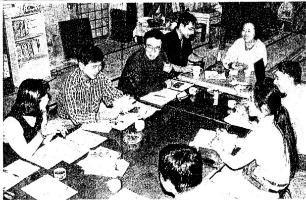
地域通貨について話し合う市民たち

上田市で、住民の助け合いを独自の点数や貨幣に置き換え、地域で流通させる「地域通貨」を旨とする発足準備が始まった。有志約十人が参加、どのような通貨をつくるかといった基本方針や会の運営などについて話し合った。今月中旬ごろから参加者募集を始め、十二月中旬には「通貨」を実際に使い始める計画だ。